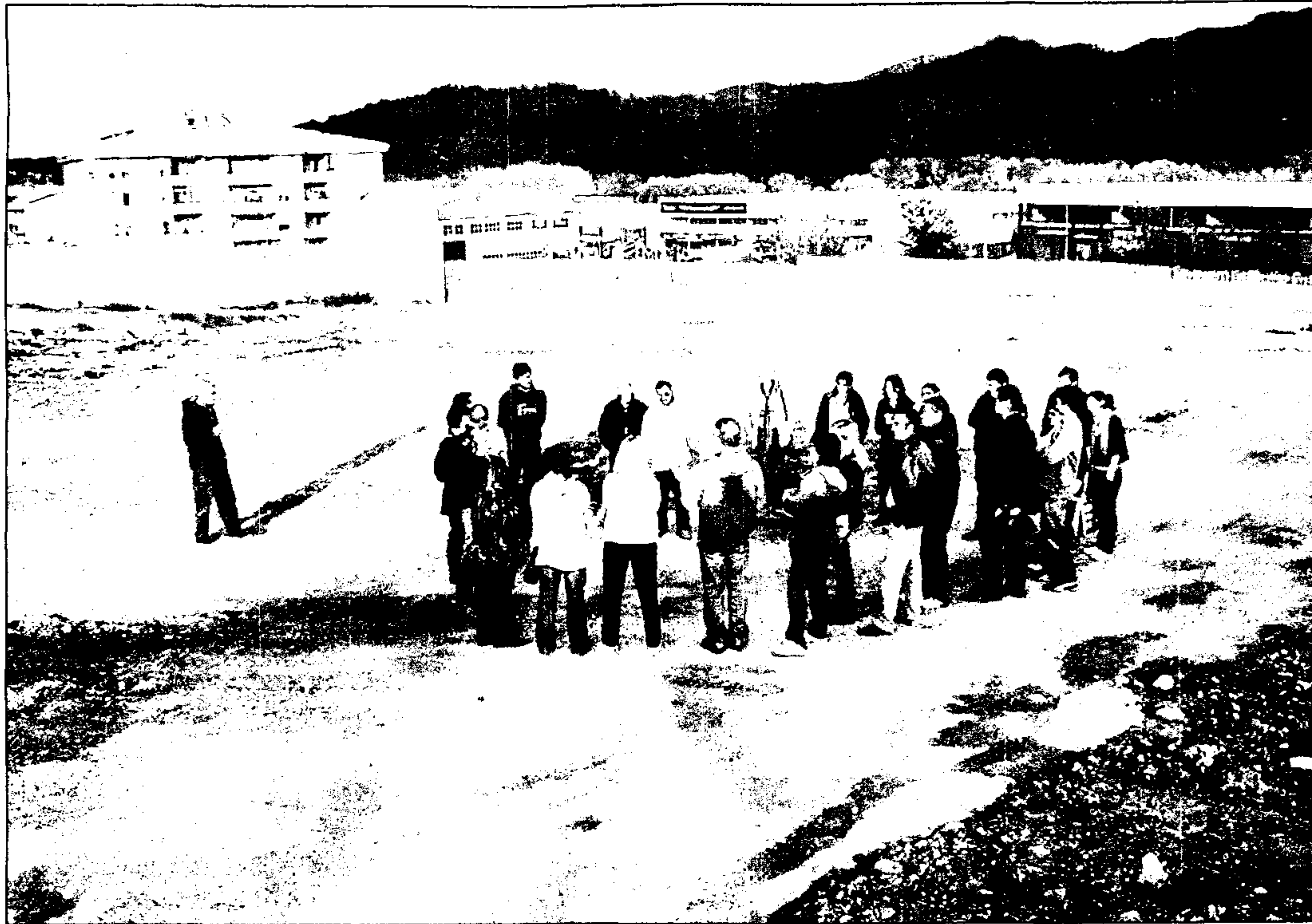
Els membres de la comissió de barraques i els tècnics municipals van visitar el solar de la Forestal dimecres passat

En els dos darrers anys, aquestes activitats s'havien fet a la zona residencial Esports. El trasllat es justifica per mantenir el caràcter itinerant de la festa. A més, l'Ajuntament destaca que els terrenys de l'antiga Forestal són un espai cèntric -situat a