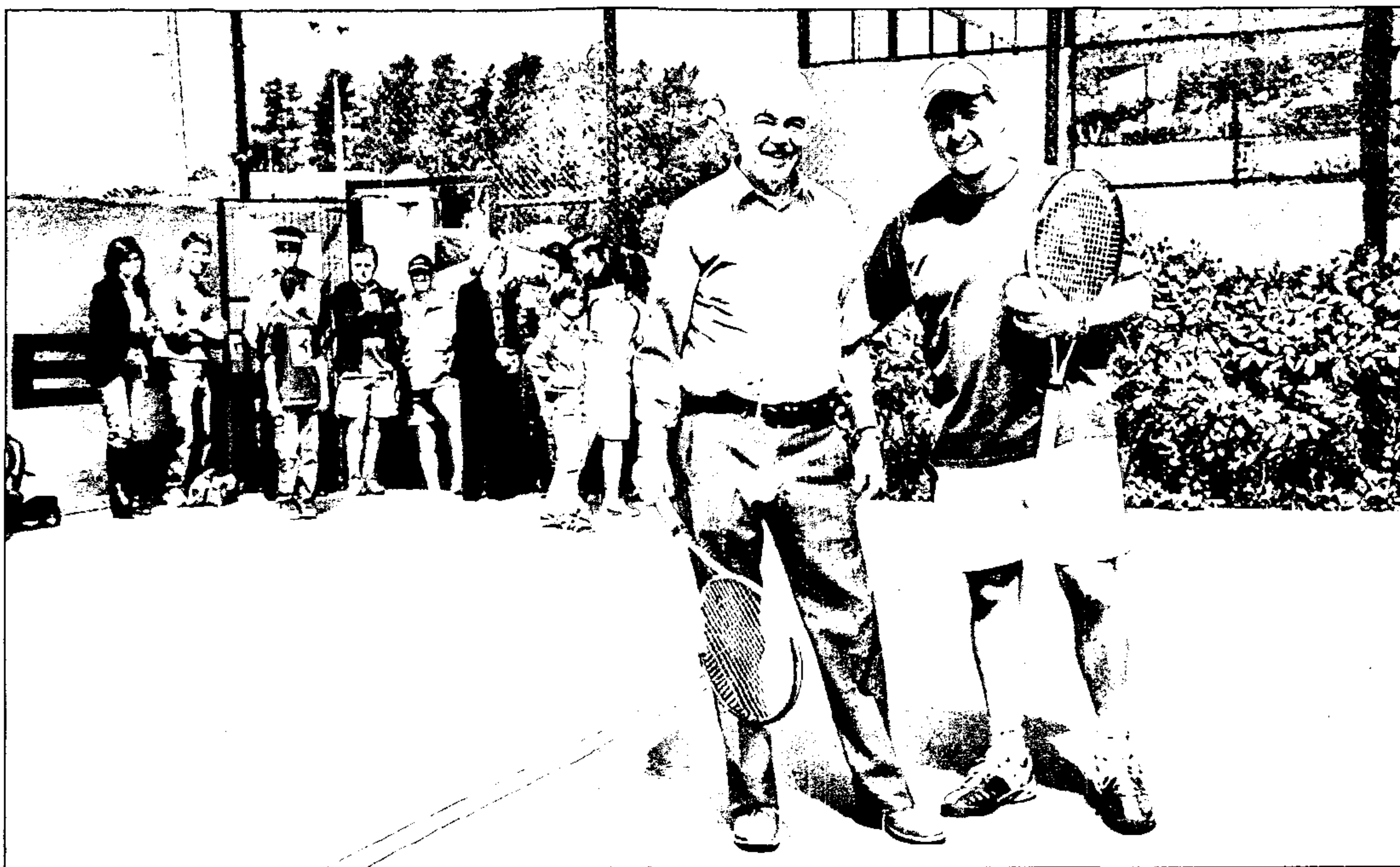
L'expresident Pasqual Maragall es va atrevir a donar uns cops de raqueta aquest dissabte a Vallromanes